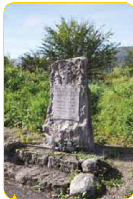
Stèle commémorative à Maillat