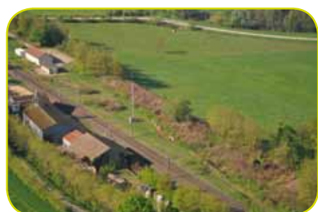
Avant la destruction

ouverte à tous vents, la halle se détériorait, et sur avis majoritaire du Conseil municipal, la décision fut prise de raser l'ensemble !!!! (fin août 2012)