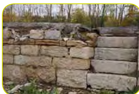
vestige d'un quai