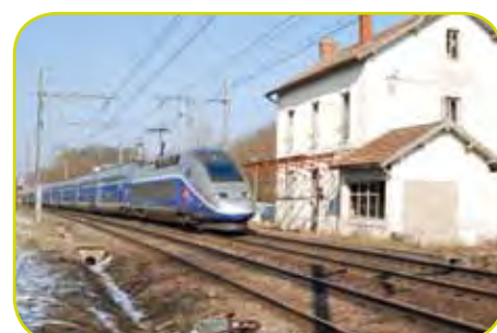
et le TGV qui cache l'histoire.