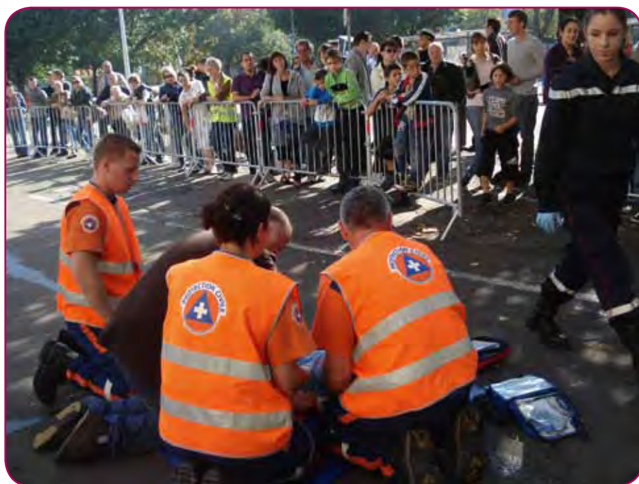
Un public venu nombreux.

de la Protection Civile Stéphanoise) devant de nombreux spectateurs très attentifs. Le matériel médical est mis en place, Les données médicales de la victime sont collectées. Soudain, l'état de la victime s'aggrave, du malaise, on passe à la perte de connaissance puis arrêt ventilatoire et arrêt circulatoire. Les gestes appropriés sont rapidement mis en œuvre ainsi que la pose du DSA « Défibrillateur Semi Automatique ». Tout au long de cet exercice, le speaker explique les gestes effectués, le matériel utilisé, la pose du DSA puis invite le public à venir pratiquer les gestes de premiers secours sur des mannequins mis à leur disposition. Cette démonstration a suscité beaucoup de réactions auprès du public dont une volonté de se former aux gestes de premiers secours.