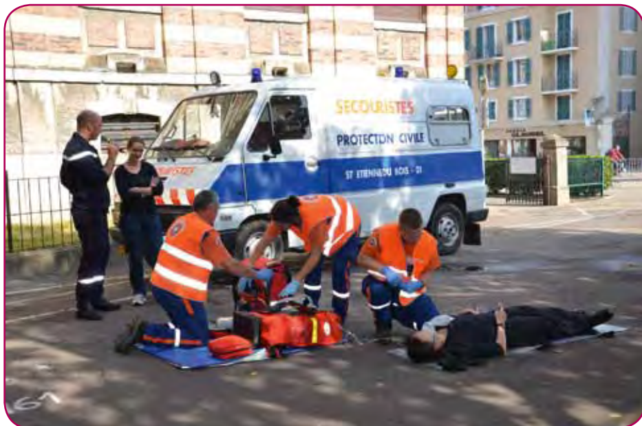
L'équipe des secouristes de St Etienne-du-Bois et le speaker.