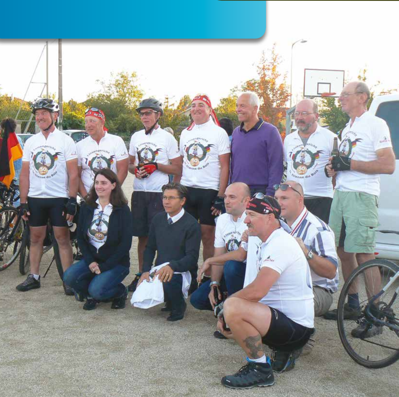
Le 50ème anniversaire du Jumelage